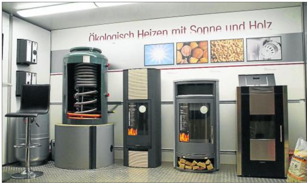
Blick auf wasserführende Kaminöfen.