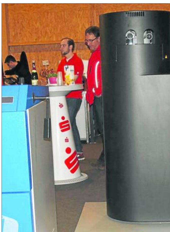
Die richtige Beratung zwecks Förderung und Zuschüsse bekamen die BesucherInnen von den Mitarbeitern der Sparkasse Oberhessen, die hier mit ihrem Stand zwischen den Ausstellungsobjekten nur zum Teil zu sehen sind.

Für das leibliche Wohl sorgte an beiden Tagen das Team vom Gasthof „Fuldaer Hof“ in Maberzell.