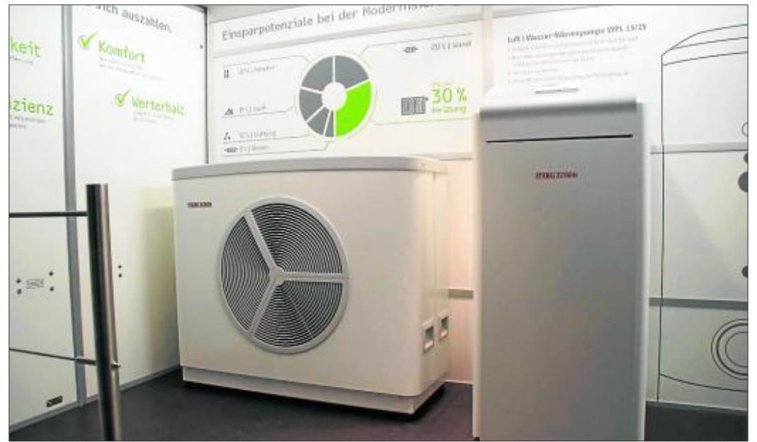
Eines von vielen Angeboten an Wärmepumpen.